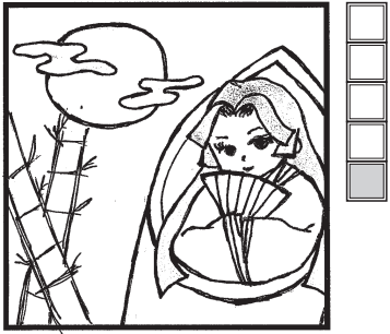
イラスト 林田 愛