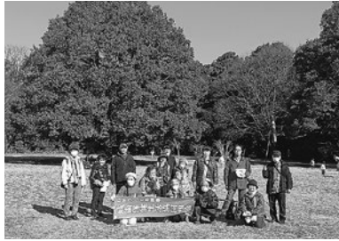
公園内の古代芝生広場で記念撮影

毎年開催している新春ハイキング、昨年は川崎市多摩区の自然遊歩道。2020年は生田緑地を散策。そして今年も、「東高根森林公園ハイキング」。3回続けて川崎市多摩区散策。1月8日(日)に開催し、参加は16名でした。