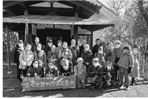
萬福寺にて(第20回まち歩き)

組んだ変化のある地形の中に植物群落があり、季節ごとの花を楽しむことができます。JR南武線宿河原駅に集合し、二ヶ領用水宿河原堀を通り、市の重要歴史記念物の絵が所蔵される常照寺や宿河原八幡宮へ。これが多摩丘陵かと思えるような長い坂を上り、妙楽寺、長尾神社へと向かいました。長尾神社では、毎年この時期開催の射的祭を見学できました。そして、東高根森林公園へ。よく整備された公園内を散策し、芝生広場に到着。この日は天気も良く、たくさん家族連れでにぎわっていました。ゴールのJR南武線久地駅まで約6キロのコースを楽しく歩きました。