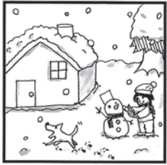
ゆきやこんこ ○○○やこんこ