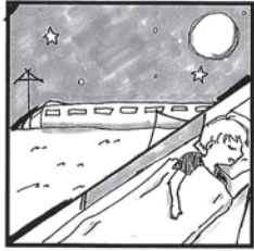
上野舟の○○○○○○○ おりたときから