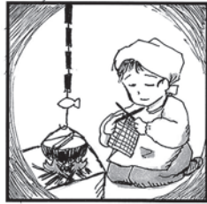
かあさんは○○○をして 手袋編んでくれた

解き方は、イラスト横の色網のかかったワクの文字を並べると、ある言葉になります。それが答えです。答えのヒントは