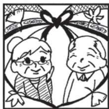
9月の第3月曜日は何の日?