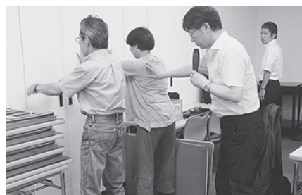
参加者全員に指導していただきました

あり、バランス能力改善のためのトレーニングが重要になってくること。そのために、運動と足裏・足指の感覚、足筋力アップが大事であり、足指でのタオルつかみ、足指でのモノ探し、四つん這いでの手足上げ、立位で前方への重心移動など、さまざまなトレーニングの説明と実技指導を行っていただきました。ここで学んだことをしっかり実践し、転倒ゼロをめざしていきたいと思います。