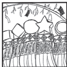
7月7日 仙台の祭が有名