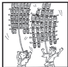
秋田の祭 長竿に提灯