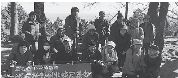
天気もよく気持ちのいい1日でした

号の「腹八分」が心に残りまして。参加できませんでしたが、皆様の日常の献身に頭が下がります。私、ブルスさんのファンです。(68歳・女性) ・毎号、健康によく記事を読んでいます。(68歳・女性) ・「城南の保健」を読んでいると、行事が豊かで、また手配りボランティア募集が必ずあり、このような記事を出せば、少しは協力しなくてはと思えますね。(71歳・女性)