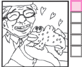
ハゼの一種。有明海 などの干潟に生息

解き方は、イラスト横の2重ワクの4文字を並べると、ある言葉になります。それが答えです。答えのヒントは