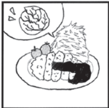
千切りにして トンカツと一緒に