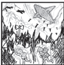
1945年3月10日 東京が火の海に