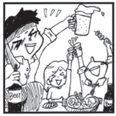
今年もあと少し 飲むぞお