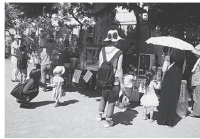
今年も楽しくまつりをやりました