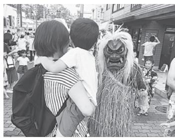
まつりには「なまはげ」も登場