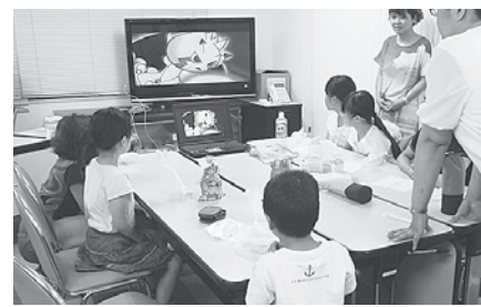
歯みがきの大切さを学んでから実践です