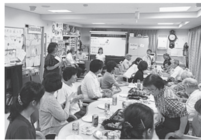
平和への願いを込めて