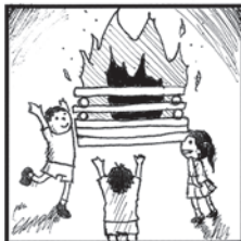
燃えろよ燃えろよ