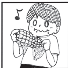
焼いても 蒸してもおいしい