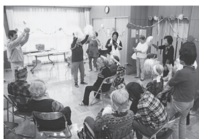
楽しく元気になった1日です

●若い頃、将来のことや自身の希望や夢が広がっていました。今、ニュースを見るたびに、子どもや孫の世代に何がみえているのか、とても不安を感じています。(78歳・女性)