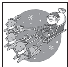
ヒゲがもじゃもじゃ