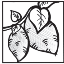
焼いたり、蒸かしたり