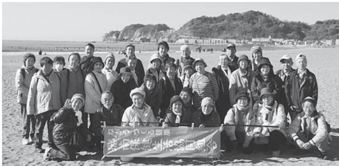
1年のはじまりのハイキングで記念撮影

毎年恒例の鎌倉ハイキングを1月10日(日)に行いました。鎌倉駅から由比ヶ浜に向かい、海沿いを歩いて御霊(ごりょう)神社、長谷観音、高德院の大仏と回り鎌倉駅に戻るコースと、途中で別れて佐助稲荷から銭洗い弁天まで歩くコースでした。