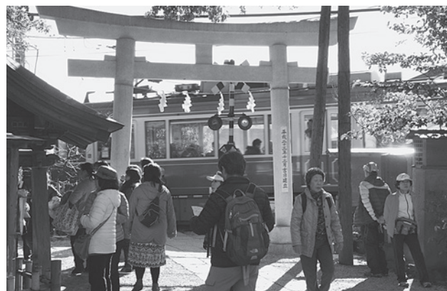
鳥居のすぐそばを江ノ電が走ります

長谷観音では、展望台からの眺めがすばらしく、鎌倉の街や由比ヶ浜とその向こうの太平洋を一望できました。高德院では、境内の巨木にリスの姿を見ることができました。健脚コースでは佐助稲荷の赤い鳥居の並ぶ階段を上り、さらに険しい山道をしぼく登って大仏山ハイキングコースに出ました。