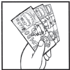
当たりますように

解き方は、イラスト横の2重ワクの6文字を並べると、ある言葉になります。それが答えです。