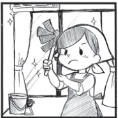
1年の汚れを落としましょう