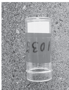
蓋を取って逆さまに付けます

長年、測定して積み重ねられたデータは、大気汚染の改善のために大きく役立っています。これからも続けていく必要のある大切な測定です。これまで取り組んでこられた方は引き続き、そして測定したことのない方はぜひ、今度から測定してみませんか。ご希望の方は、保健生協本部(3762-1026)までご連絡ください。