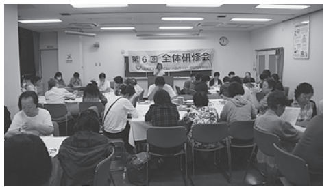
かがやき事例でヘルパー交流

グループホーム虹の家では、第1回目となる「事例検討会」を、9月25日(金)、大田区消費者生活センターで開催しました。「しおかぜ」と「みちづか」の職員が集まり、日々入居者さんと生活する中での出来事や職場で感じたこと、改善すべきこと、それぞれのグループホームでの事例などを話し合い交流しました。