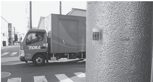
道路沿いの電柱などに取り付けます

け、24時間後に取り外すだけです。そのカプセルを提出していただき、試薬を入れて反応を分析します。そうすると、自動車などから排出される空気中のNO 2 (二酸化窒素)濃度が測定できます。NO 2 濃度が高いと喘息、肺気腫、肺がんなどの病気の発病に影響します。