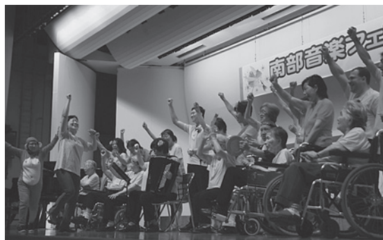
歌は楽しく元気よく

グループホーム「虹の家みちづか」の入居者さんとその家族・職員・近隣の応援団の皆さんが、毎年参加している「南部音楽フェスティバル」で素敵なコーラスを披露してくれました。