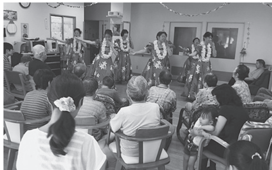
芸達者な しおかぜの職員の皆さん

て楽しく過ごします。職員がそれぞれの特技を活かして、さまざまな出し物を披露。フラダンスにマジック、踊りに歌などいつもとは違う顔を見せ、入居者さんを楽しませて