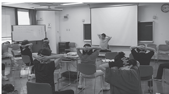
転倒防止に最適な体操です

10月3・4日、大田区生活展が開催されました。場所は大田区消費者生活センター。今年も骨密度測定で参加し、2日間