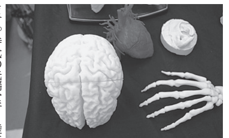
3Dプリンターによる模型

異分野の人たちと交流する中で、ものづくりで得たノウハウを積極的に提供。「ごっくんチェッカー」の筐体部分*2の試作、開発中の「開口カトレナー」の容器など、プラスチック加工の専門家ならではの役割も発揮。現在はCT*3やMRI*4の画像から三次元データを作成、骨格や脳・心臓なども自由な大きさで作成可能。さらにプラスチック樹脂だけでなく、チタンやニッケルなどの金属系材料を利用した三次元造形が実用化され、医療や介護分野での活用可能性は広がっている。