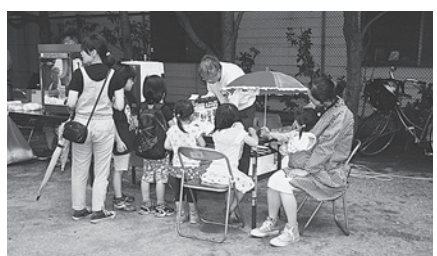
子どもたちと楽しく交流

7月18日(土)、大森・糀谷支部主催で「なかしんまつり」が行われました。今年で10回目を迎えます。場所は大森中診療所裏の公園。今年も、風が強く、時折雨が落ちてくる