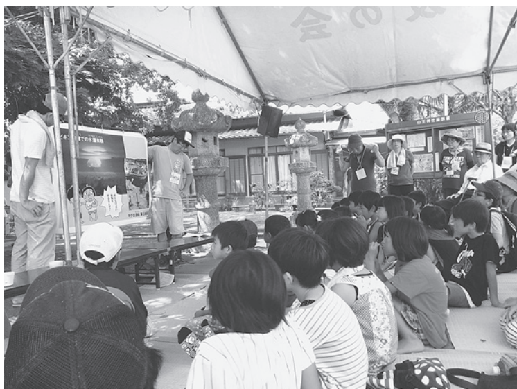
「少女少女平和のつどい」被爆について学びました

つげる太陽の中で死んでいった人びとのことを実感させられました。ここに集った子どもたちの、