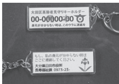
見守りキーホルダー(一部加工しています)

高齢者見守りキーホルダー登録システム(みま〜もキーホルダー)は、大田区さわやかサポート入新井からはじまり、2012年度からは大田区全域で導入。現在では、千代田、中央区、坂戸市、土浦市、日田市、小城市、胎内市など全国に広がっています。