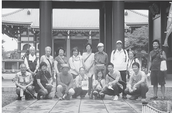
池上本門寺山門前で記念撮影