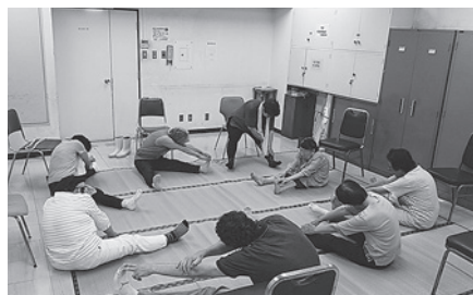
みんなで楽しく体操します