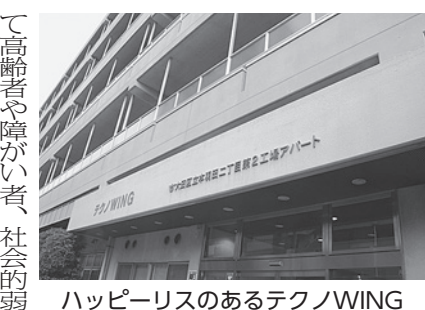
ハッピーリスのあるテクノWING