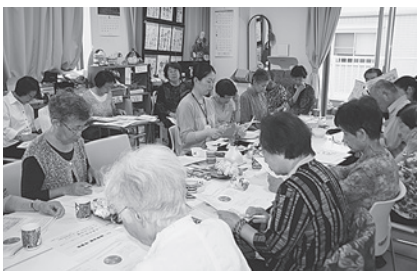
看護師などが講師で学習会