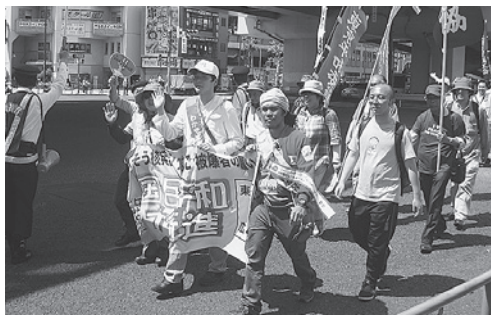
平和を願い力強く行進

核兵器廃絶などを訴える国民平和大行進(東京→広島コース)が5月7日(木)、品川区、大田区を通り、今年も、川崎市役所まで“平和への願い”をつなぐことができました。