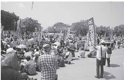
夏のような暑さの中での大会

5月1日(金)、代々木公園で「第86回中央メーデー」が行われました。大会後のパレードでは、新宿・明治公園・恵比寿の3コースに分かれ、道行く人びとにアピールしました。