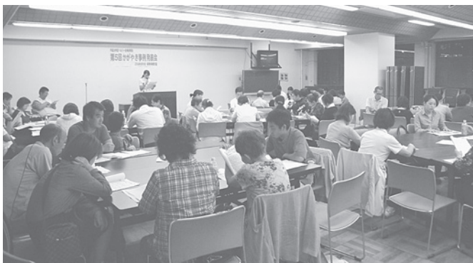
事例を発表しあい、よりよい介護に