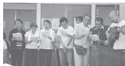
交流会も盛り上がりました

しかしそれは、Ａさんが自分でできることを掃除しないのではなく、膝への負担を考え、自分ができること・できないことを分けていただけだとわかりました。そして、自分の膝の痛みや、それともなう悩みをまわりの人にも理解してほしいことになりました。