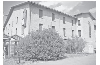
町中には世界遺産のような建物が

ポロニーヤ市の人口は38万人(私の住んでいる品川区とほぼ同じ)で、美術館や博物館などが37あり、そのどれもが第一級。ついでにいうと映画館が50、劇場が41、図書館はなんと73カ所。あまりの違いに呆然と