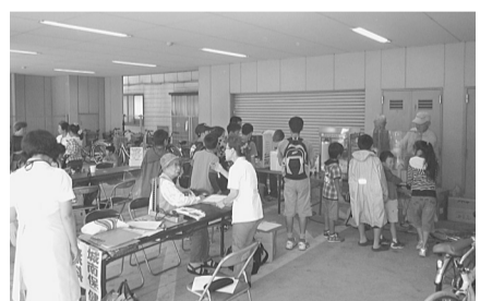
雨の中でしたがたくさん来てくれました

7月21日(土)、大森・糀谷支部主催で行われました。今年で7回目を迎えます。毎年大森中診療所裏の公園で開催しますが、今年は雨模様で、診療所駐輪場で行いました。それでもたくさんの子どもたちや組合員さんが遊びにきてくれました。また、7月22日(日)には全国鶴の木まつりも行われました。