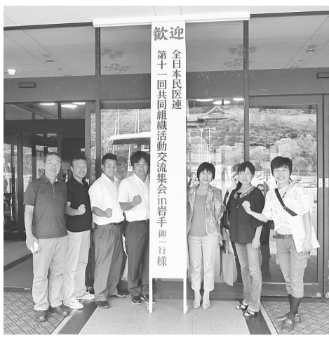
参加者全員で記念撮影 (会場入口で)

9月25日、岩手で3日、岩手で行われた交流集會に参加しました。約1800人の参加で、過去から見ても多数の参加で盛り上がりました。