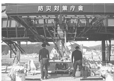
防災対策庁舎で献花

5月18日(20日、城南グループの職員(南部医療労組の組合員中心)5人が「気仙沼復興支援ボランティア」に行っていました。