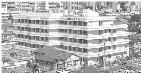
上の写真は新大田病院の全景と、下の写真は解体工事が終わった旧館