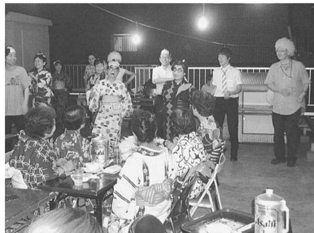
職員による変装の出し物には拍手喝采

* 検査は、病体生理研究所に一括委託して行います。検査結果については、本人に直接郵送します。検査結果が陽性(便潜血 (+)) の場合はかかりつけの医師、または城南保健生協本部まで速やかにご相談ください。 * 1回だけの検査で「異常なし」でも、必ず年1回以上の検査をおすすめします。