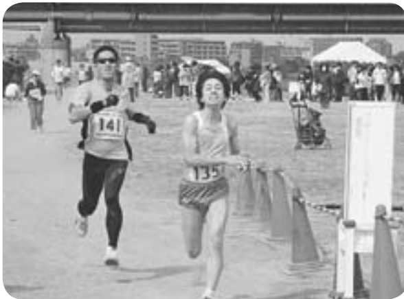
まもなくゴール 必死の表情