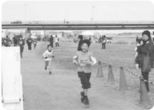
子どもたちもがんばりました