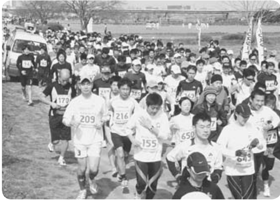
ハーフ スタート直後