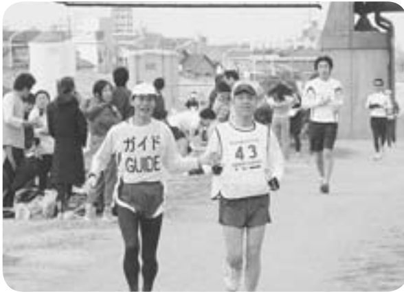
眼の不自由な人も