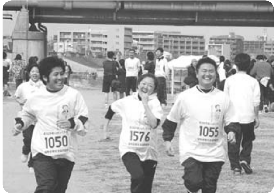
10kmランナー 笑顔でゴール