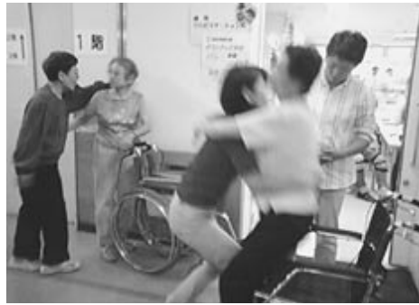
車いすから抱えあげる実技訓練をしました