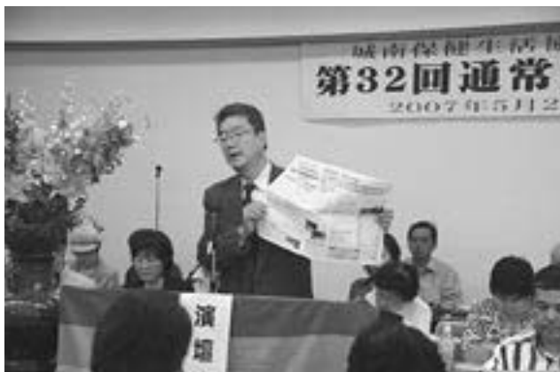
議案の提案をする植田専務理事