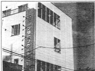
(2月26日に引き渡しが行われます)