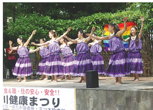
品川健康まつり・フラダンス

・ウォークラリー、バスハイク、健康まつり、ハイキング、ダンスパーティー、駅伝フェスティバルを引き続き行います。