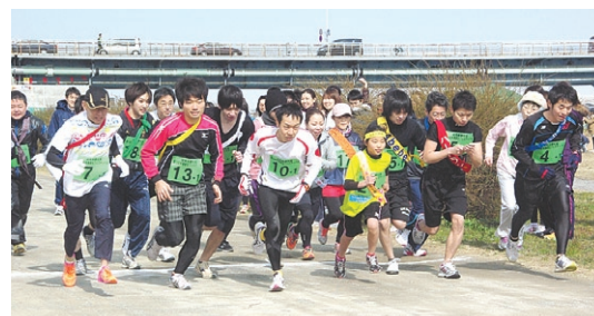
駅伝フェスタ・スタート