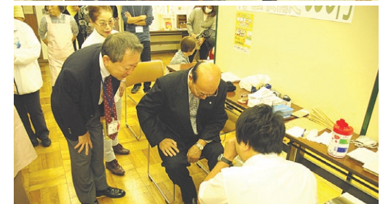
大田区生活展で骨密度測定