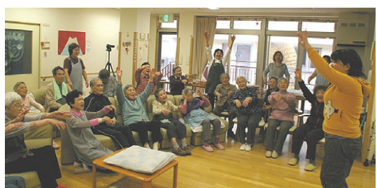
グループホーム虹の家しおかせ

・消費税増税反対、T P P参加反対への共同の取り組みをすすめる、国民健康保険料の減免、引き下げ、後期高齢者医療制度の廃止、年金制度改善などの国民的運動をすすめます。