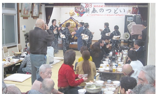
西品川支部新春のついで