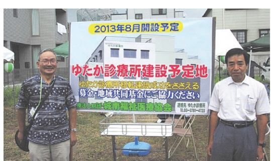
ゆたか診療所建設予定地