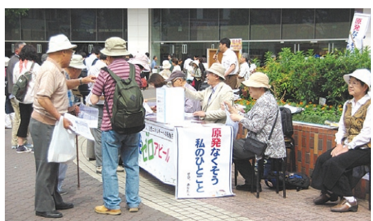
原発ゼロアピール行動（蒲田駅西口）

消費税増税、T P P参加、原発再稼働、普天間基地の辺野古移転などあげればキリがありませんが、いつも「いのちの平等」といったあたりまえのことを決して見失わず「事業と運動を車の両輪として」1年間取り組んでいきましょう。